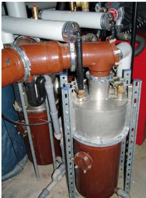
Zwei TechnaPlus-Wärmetauscher hinter dem neuen Ölkessel